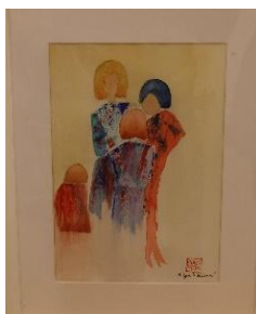
Tokyo Akvarell av Helga Weissner