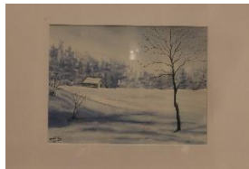
Vinterlada Akvarell av Maria Kinley