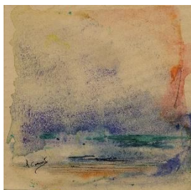
Nice Akryl av André Camart