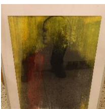
Mellan hopp och förtvivlan Akryl av Mai Pamp