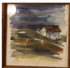
Huset på heden Akvarell av Christina Cramer