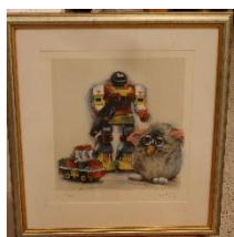
Robot Litografi av Lasse Åberg