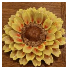
Solros av Keramik av Susanne Danielsson