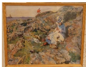
Pigan på klippan Litografi av Carl Larsson