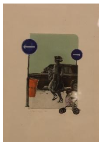
Springande damen Litografi