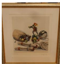
Leksaker Litografi av Lasse Åberg