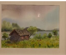
Bod Akvarell av Håkan Groop