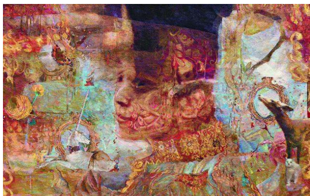
centrum, men även djur och växtlandskap avbildas.