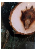
Gunnel Nordgren "Om vargen kommer" – Foto ca 29 x 19,5 cm