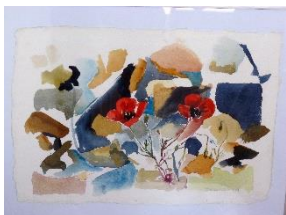
Torbjörn Svanström "Från Naxos" – Akvarell ca 31 x 43 cm