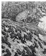
Eva Holmer Edling "Hare" – Etsning ca 20 x 16 cm