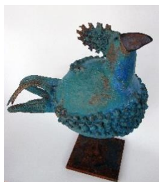
Lisa Leander Ahlgren "Fågel" – Keramik ca 50 cm hög