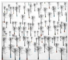
Nina Korch "Träden" – E.T grafik ca 31,5 x 35 cm