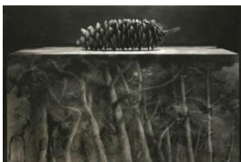
Lars Östling "Kotte" – Djuptyck/Mixed Media ca 40 x 26,5 cm