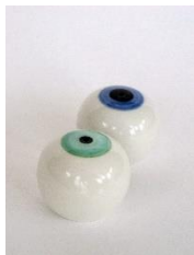
August Sörenson "Voyeur" – Salt- och pepparströare, Keramik. ca 5 cm i diameter