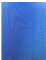
Jan Hjort "Blott Blått" - Foto ca 38 x 29 cm